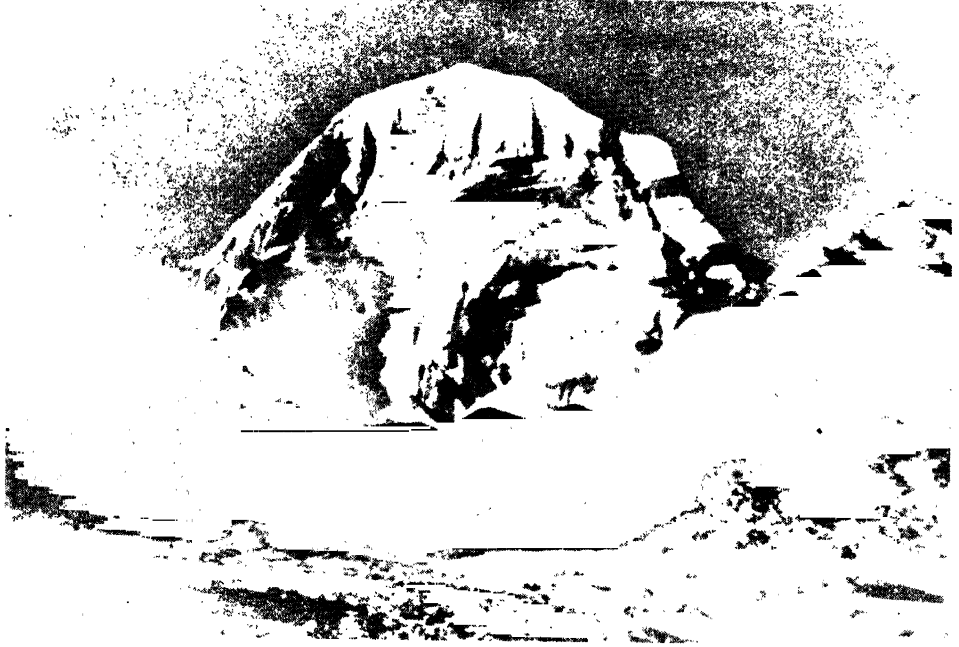
দূর হইতে কৈলাস

তিনটি ফাঙ্কের মধ্যে একটা পড়ে ভেঙে গেল। তাই মন খারাপ। সরযু-নদীর তীরে সেবাঘাটে এসে উপস্থিত হলাম বিকেলে। এই সেই পবিত্র সরযু, রামায়ণের আদিতে অস্ত্রে প্রবাহিত।